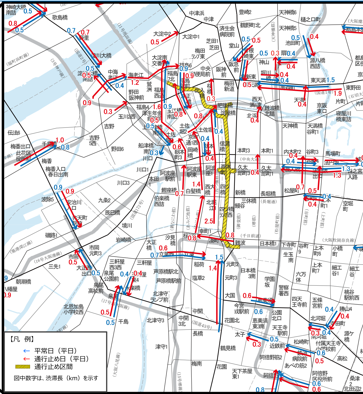
期間中の一般道路の渋滞予測 (8時台)