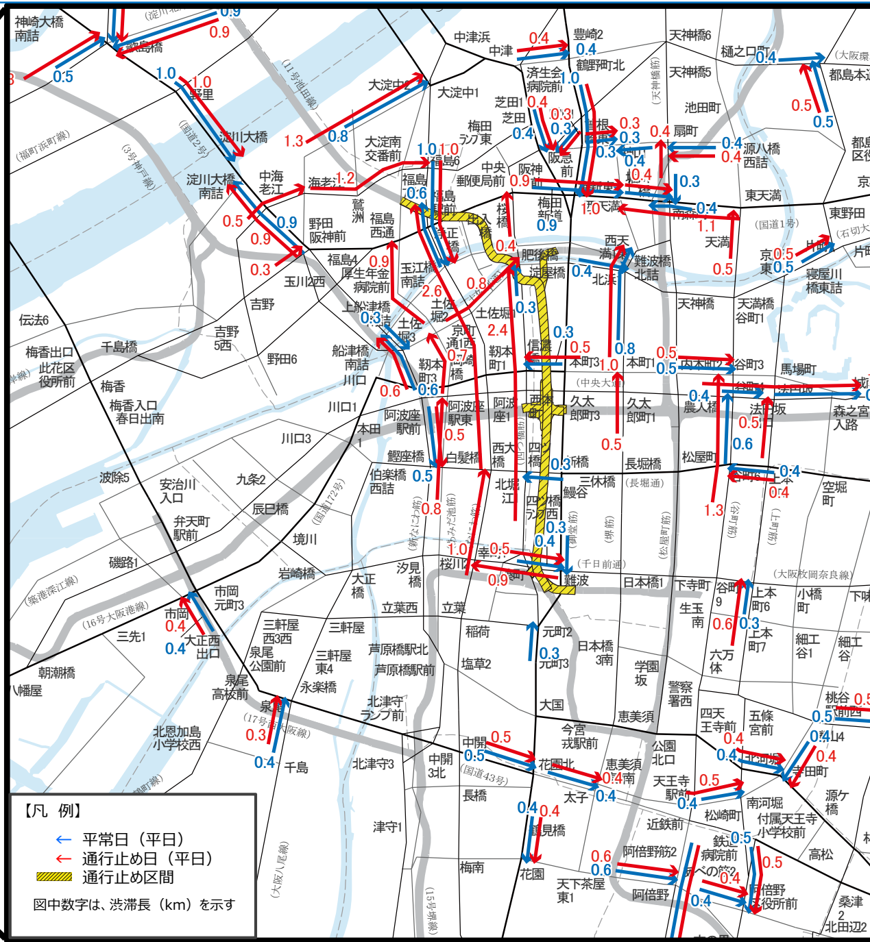
期間中の一般道路の渋滞予測 (17時台)