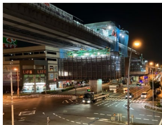
【工程短縮例：防音対策により昼夜間連続作業を実施】