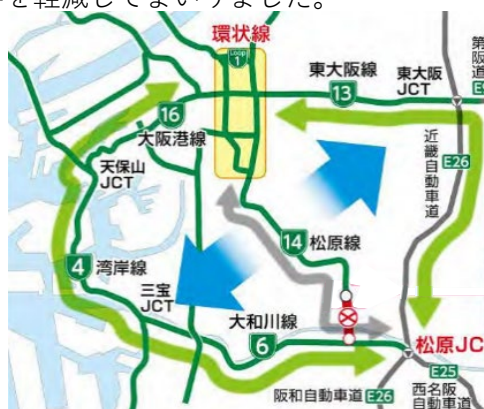
【大和川線等を用いたう回路】

これまで喜連瓜破付近大規模更新事業では、6号大和川線の開通により高速道路ネットワークが拡充したことで、近畿自動車道と併せてう回路として活用することができ、松原線通行止めの交通影響を最小限にとどめてまいりました。また、通行止め期間の短縮のため、工程短縮の様々な取組みも行い、お客さまへの影響を軽減してまいりました。