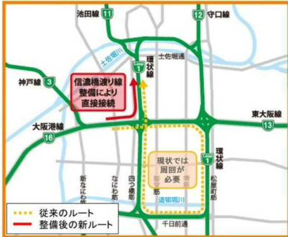
【ルート図】16号大阪港線（東行き）から1号環状線（北行き）

阪神高速16号大阪港線及び1号環状線は、大阪都心部の自動車交通における大動脈の役割を担っています。 現在、16号大阪港線（東行き）から1号環状線（北行き）へのアクセスには、環状線を半周回する、あるいは、乗り継ぎ制度を利用して一般道路を経由する必要があります。 本事業により、16号大阪港線（東行き）から1号環状線（北行き）を直接接続すること、車線を拡幅することにより、①移動時間の短縮、②スムーズな車線変更、③環境負荷の軽減を実現し、より使いやすい道路ネットワークを形成します。