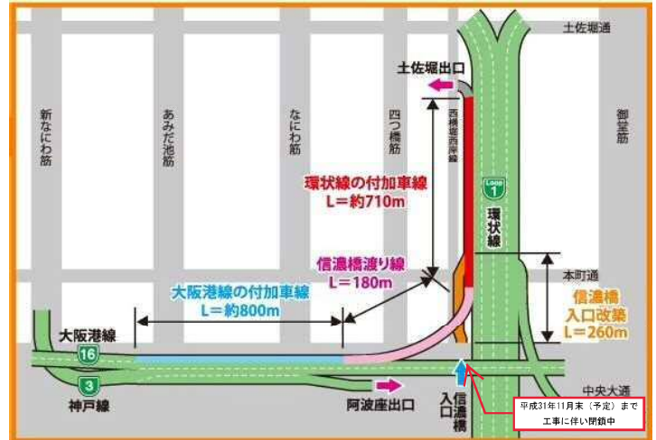
【概略図】西船場ジャンクション（信濃橋渡り線（仮称））改築事業