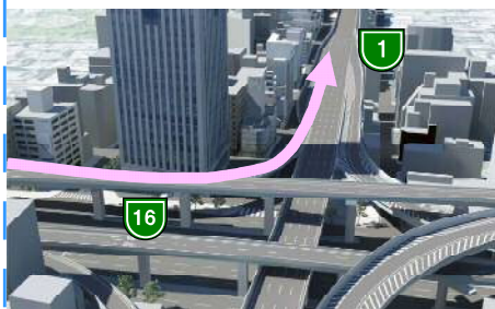
【イメージ】信濃橋渡り線（仮称）

1号環状線を半周回することなく、16号大阪港線から1号環状線へのアクセスが可能となり、移動時間が短縮し、利便性が向上します。