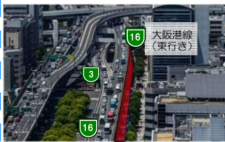
【イメージ】車線拡幅（大阪港線（東行き））