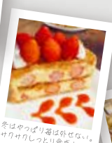
冬はやっぱり華は外せない。 サリサリしつとり愛恋!