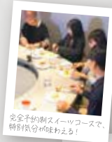
完全予約制スイーツコースで、特別気分が味わえる!