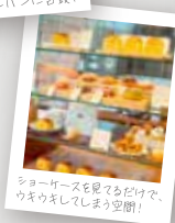
ショーケースを見ただけで、 ワクワクしてしまう空間!