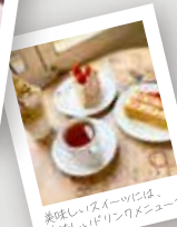
美味しいスイーツには、 美味しいドリンクメニューで!