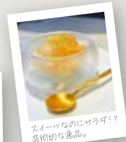
スイーツなのじゃろ可!? 芸術的な作品。