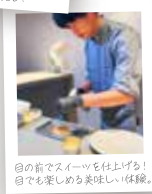
目の前でスイーツを仕上げる! 目でも楽しめる美味しい体験。