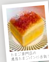
たまご専門店の 濃厚たまごパンに舌鼓!