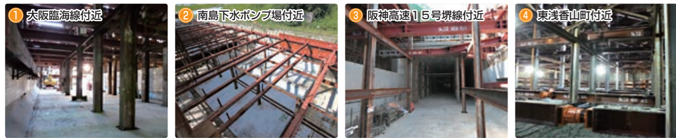
1 大阪臨海線付近 覆工板の下でトンネル本体を構築しています。 2 南島下水ポンプ場付近 トンネル本体の下面が出来上がりました。 3 阪神高速15号堺線付近 紀州街道直下のトンネル構築が完了しました。 4 東浅香山町付近 覆工板の下で掘削を進めています。