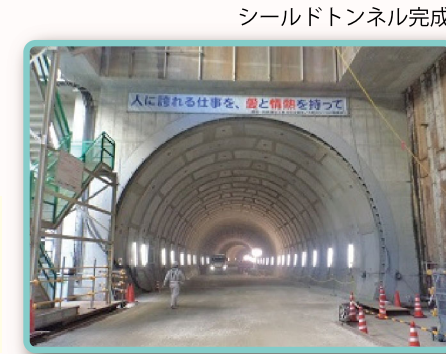
シールドトンネル完成

遠里小野～常磐地区が、シールドマシンにより2本のトンネルでつながりました。このあと、道路舗装や照明、避難通路などの工事が始まりました。