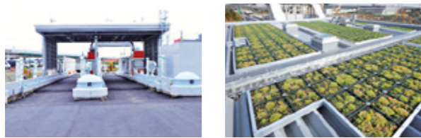
建設中の鉄砲東料金所 三宝料金所の屋上緑化状況