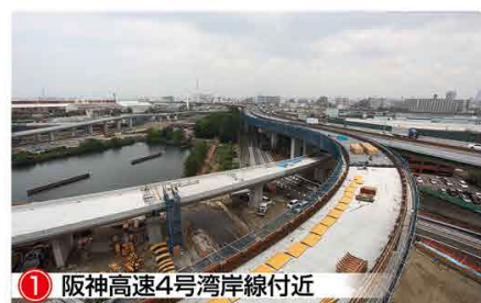
1 阪神高速4号湾岸線付近 4号湾岸線大阪方面との合流部付近の側壁を施工しています。