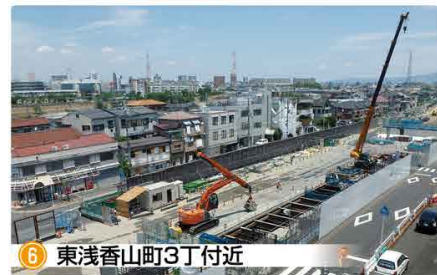
6 東浅香山町3丁付近 土留壁工事が完了し、覆工板の下の掘削を進めています。

現場の写真やリアルタイム進捗情報など盛りだくさん!「6号大和川線」のWEBサイトをチェック!! 大和川線 検索 工事期間中は、何かとご迷惑をおかけしますが、皆さまのご理解とご協力をお願いいたします。