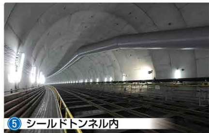
5 シールドトンネル内 トンネルは東向きにJR阪和線の直下を越え、約1450m掘り進めました。(平成25年6月末現在)