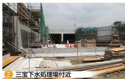
2 三寶下水処理場付近 大和川線西端のトンネル坑口部分の擁壁を構築しています。