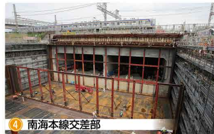
4 南海本線交差部 鉄道(南海本線)の直下を通るトンネルが、半分まで出来上がりました。