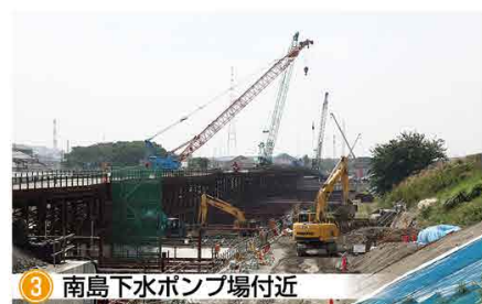
3 南島下水ポンプ場付近 どどめへきさんばし 土留壁と栈橋が完成し、これから開削トンネルを構築していきます。