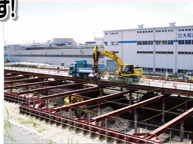
▲ 地面を掘っている状況

開削トンネルというのは、下絵のとおり、地表から土を掘り、できた穴の中にトンネルを造っていきます。開削トンネルの工事は、目に見える形で確実に進めることができ、多くの実績もあることから、安全、安心な工法です。