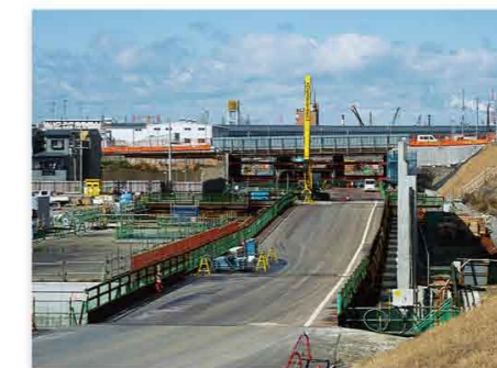
▲ 遠里小野第2工区《大阪和泉南線東側》

地面の下にはトンネルが一部完成しています。写真奥では、大阪和泉南線の下の土を掘っています。