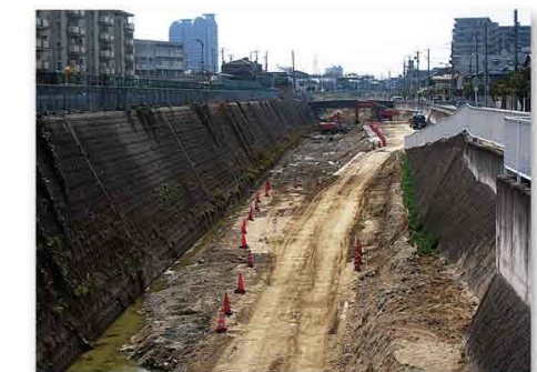
▲ 常磐工区《常磐浜寺線西側》

地面の下にはトンネルが一部完成しています。写真奥では、大阪和泉南線の下の土を掘っています。