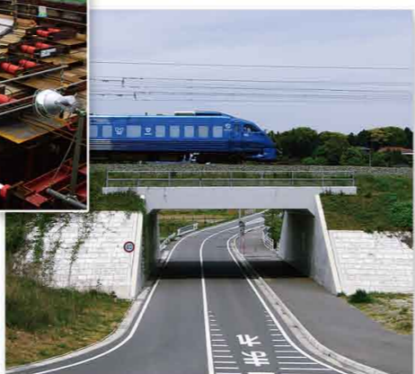
▲【完成後】鹿兒島本線・海老津

ここでの工事は、営業中の鉄道や軌道の直下で工事を進めるため、R&Cという非開削工法(地表面から土を掘らない工法)が用いられています。このR&C工法は、上部の地盤や構造物に影響を与えることなく工事を進めることができます。