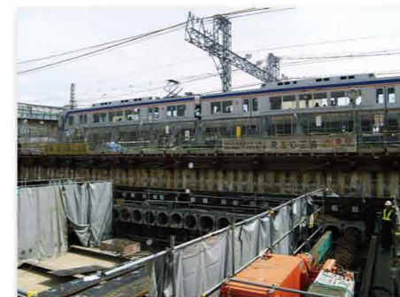
▲ 南海本線交差工区《南海電気鉄道(株)が施工》

土留壁が完成し、掘削機械やダンプトラックが載って作業する土台(栈橋)を造っています。