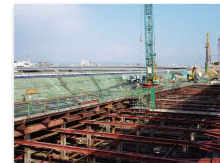
▲ 三宝第3工区(その1)《大阪臨海線西側》