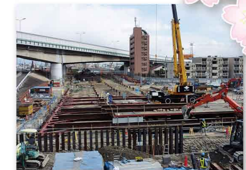
▲ 七道工区《南海本線東側》

土留壁が完成し、掘削機械やダンプトラックが載って作業する土台(栈橋)を造っています。