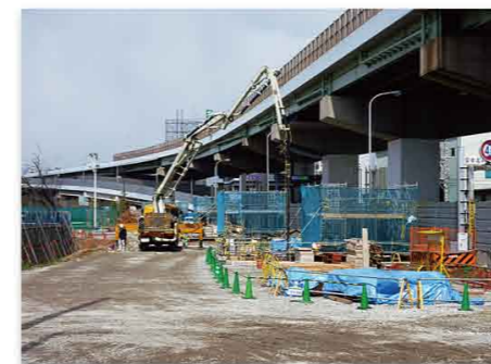
▲ 三宝第1工区《4号湾岸線西側》