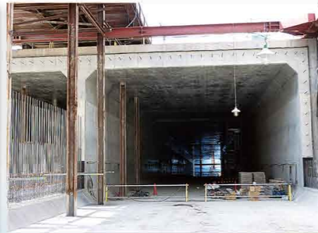
▲ 開削トンネルの一部完成状況