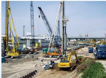
▲ 土留壁の施工状況