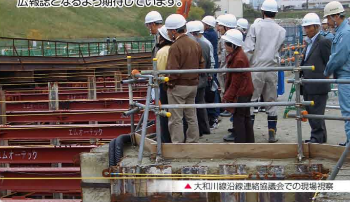
▲大和川線沿線連絡協議会での現場視察

最後に、この広報誌により大和川線について地域の理解が深まるものと喜んでおります。今後は工事のことだけでなく、出来るだけ地域の皆さんの意見を掲載していただき、より一層、地域密着型の広報誌となるよう期待しています。