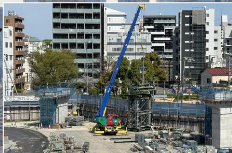
①桁架設のためのベント設置工