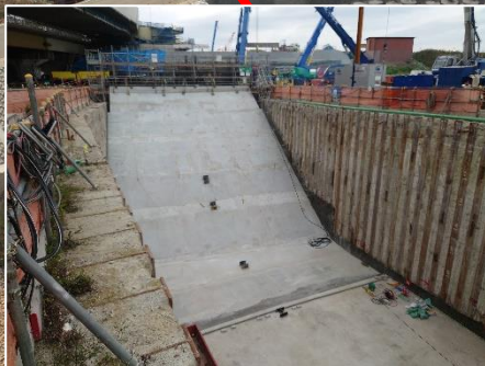
③換気塔部の躯体工