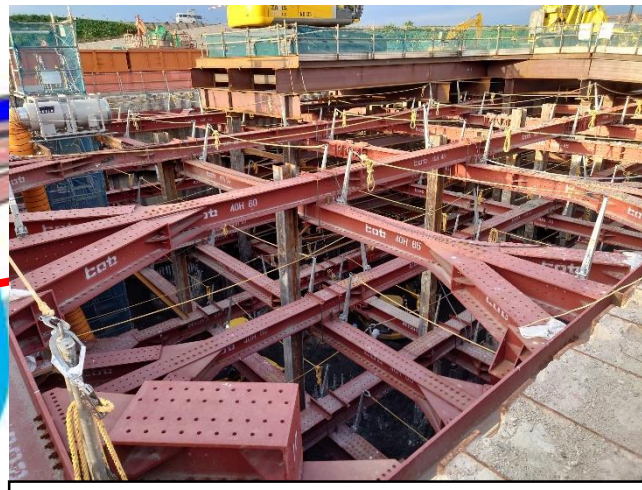
④受電所部の掘削・土留支保工