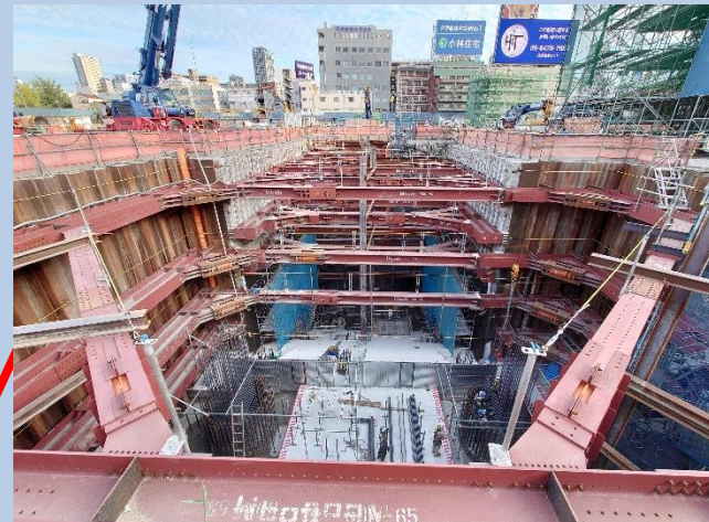
②換気塔部の躯体工