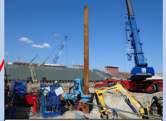
②換気塔部の土留工