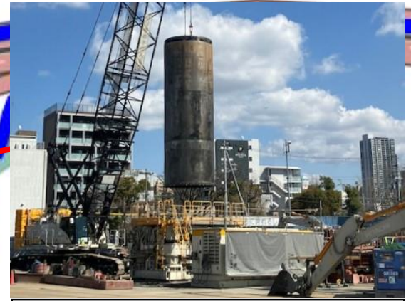
④受電所部の杭の施工