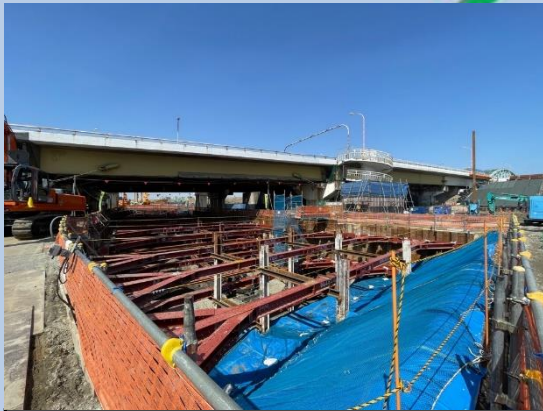
③擁壁部掘削・土留支保工