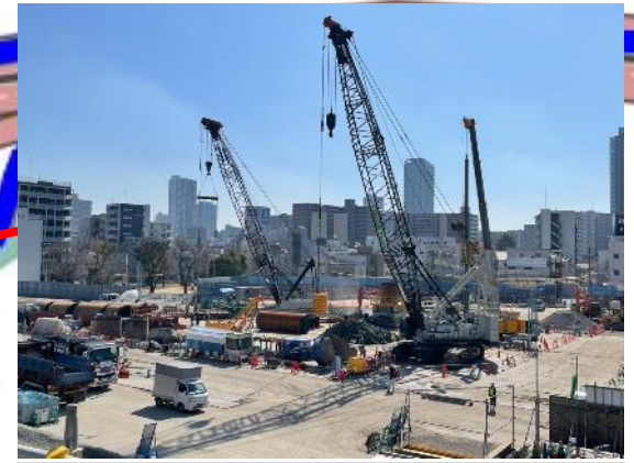
④受電所部の杭の施工