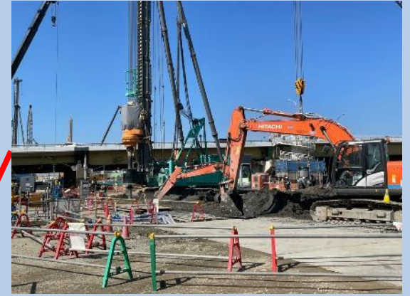
②換気塔部の杭の施工