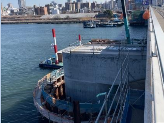
①河川内橋脚の梁の施工完了