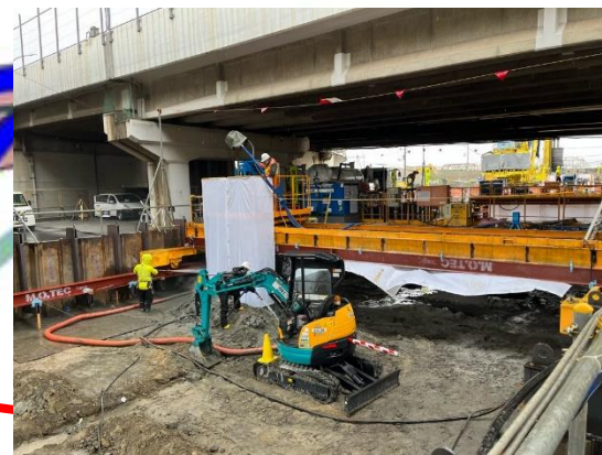
④擁壁部の地盤改良工