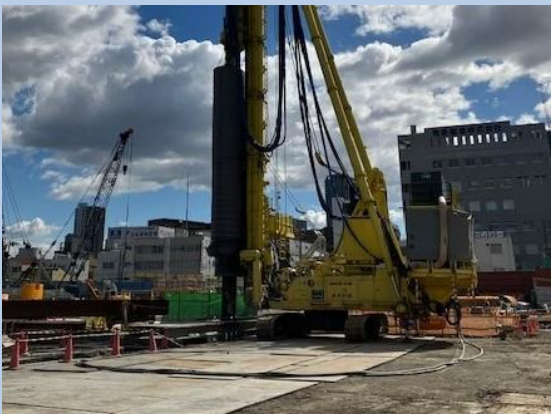
③土留工 (地中連続壁工)