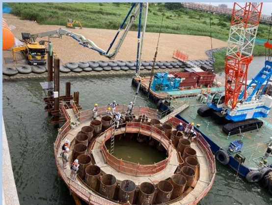
①河川内の鋼管矢板内への 中詰めコンクリート打設