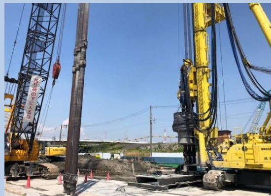
地中連続壁 (土留) 施工