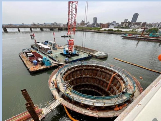
河川内の鋼管基礎内部の掘削