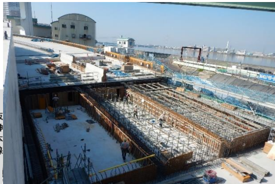
②掘割擁壁部の構築