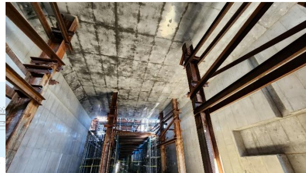
③トンネル本体の構築