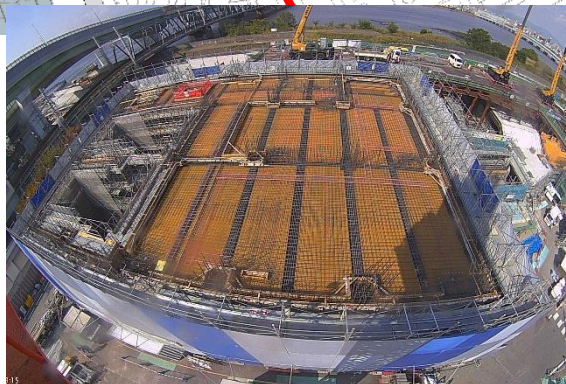
⑤換気所地上部の構築