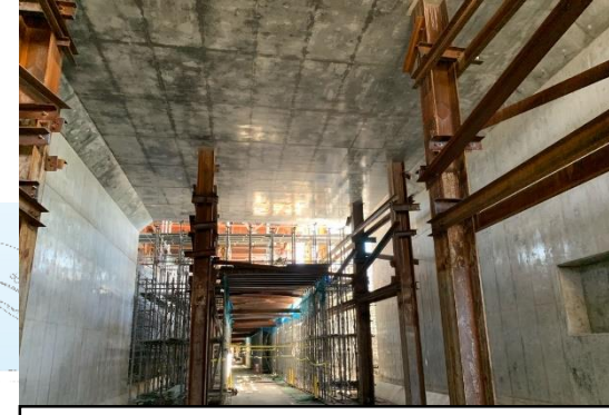
③トンネル本体の構築