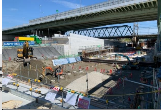
②掘割擁壁部の構築