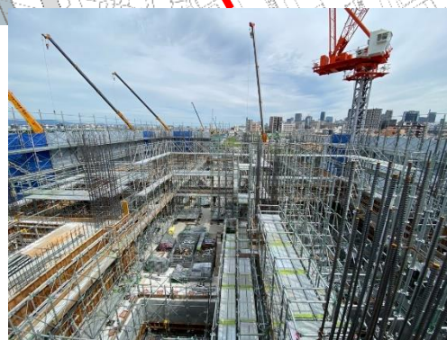
⑤換気所地上部の構築