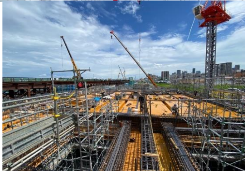
⑤換気所地下部の構築