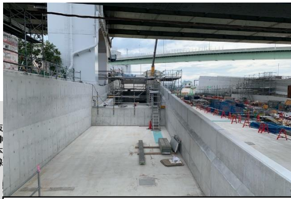
②掘割擁壁部の構築