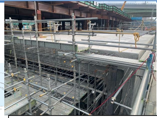
③トンネル本体の構築