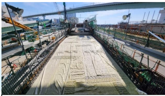
②掘割擁壁部の構築