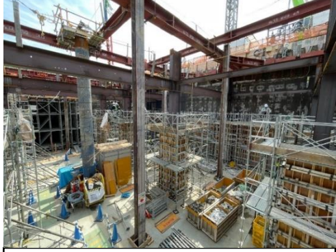
⑤換気所地下部の構築