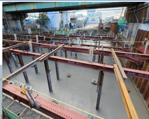
②掘割擁壁部の構築