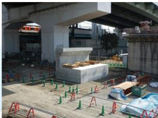
橋台本体の構築完了