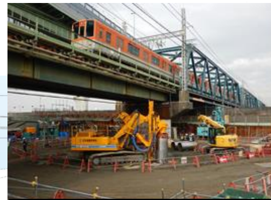
地中障害物の撤去