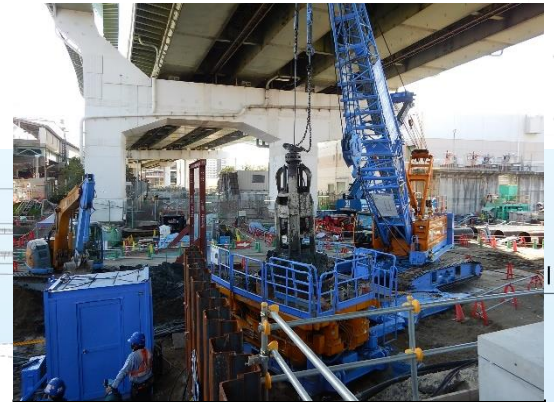
旧中津川護岸の撤去