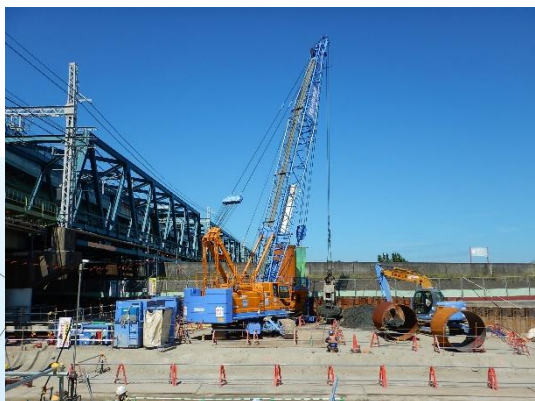
歩道橋基礎部分の撤去