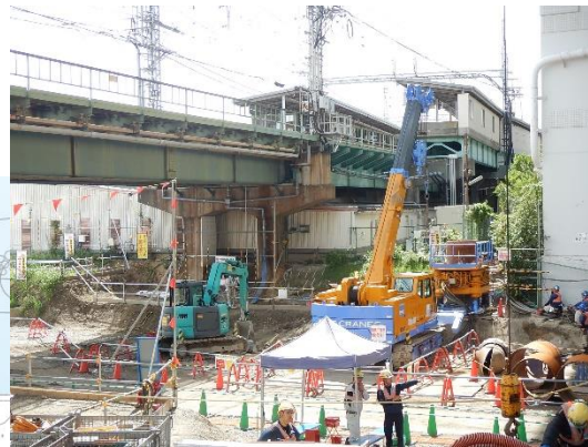
旧中津川護岸撤去