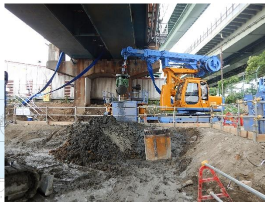
旧中津川護岸撤去