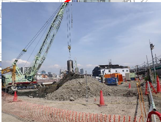
地中障害物の撤去