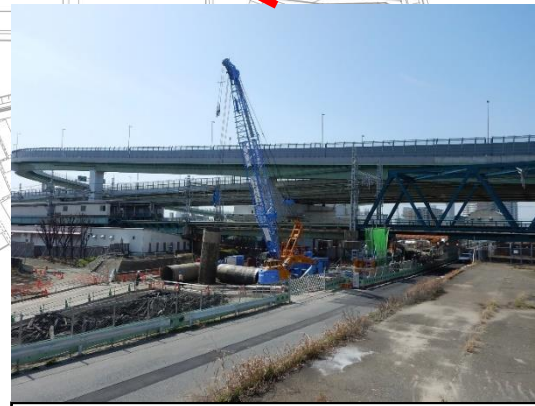
歩道橋基礎部分の撤去