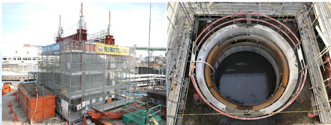
橋梁基礎の構築 (左: 外観 右: 内部)