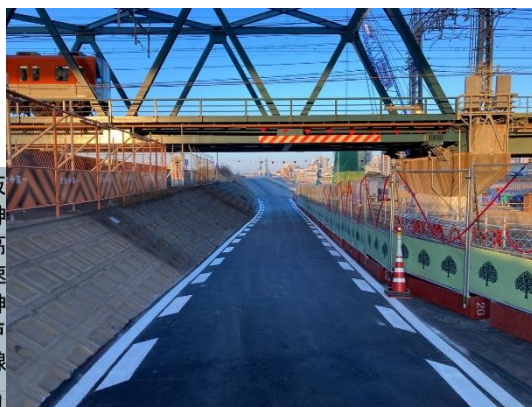
大阪市道459号線の拡幅