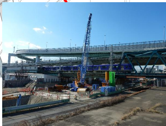
歩道橋基礎部分の撤去