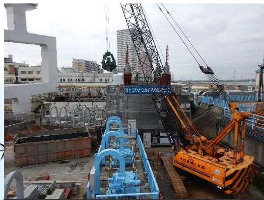
橋梁基礎の構築（掘削）