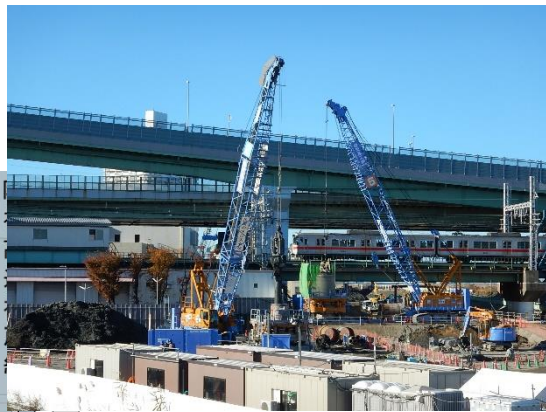
工場の基礎杭撤去 歩道橋基礎部分の撤去