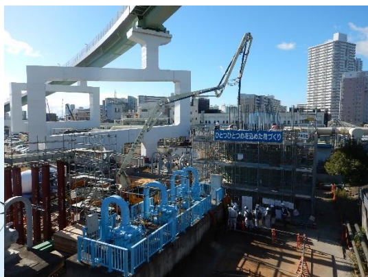
橋梁基礎の構築 (コンクリート打設)