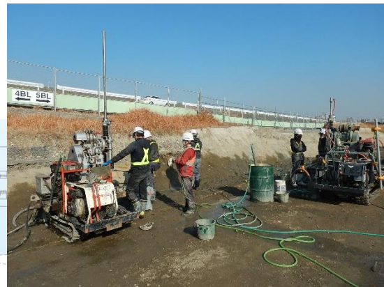
旧下水道下の磁気探査