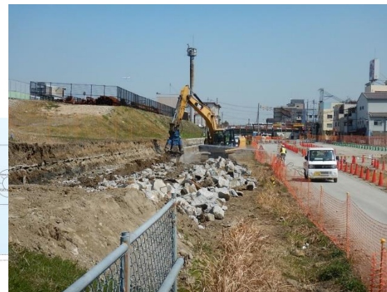
旧中津川護岸の撤去