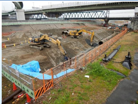
工業用水道管の撤去