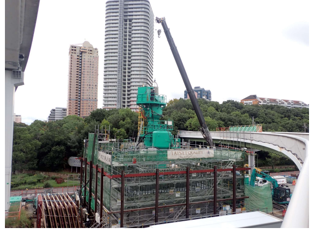
【1】橋脚(PPE-7)ニューマチックケーソン基礎工事において、6口目目の施工状況。