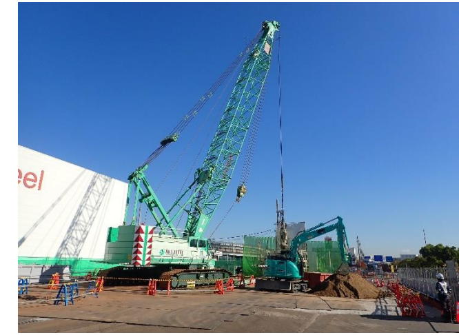
【3】高速道路の橋脚(PPE-5R)基礎工事に於いて、オールケーシング工法を用いて地中障害物の撤去中。