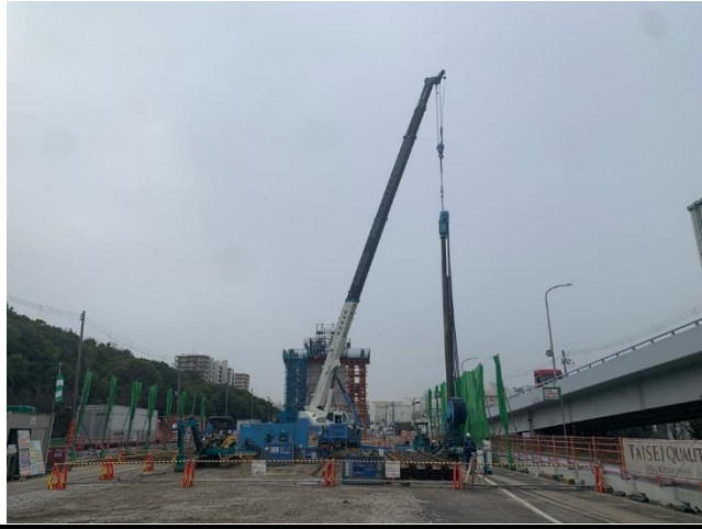
【1】高速道路の橋脚(PE-1)基礎工事に於いて、土留支保工の設置中。