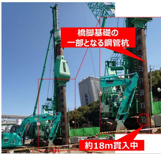
① 高速道路の橋脚基礎となる鋼管杭を地中に貫入中。