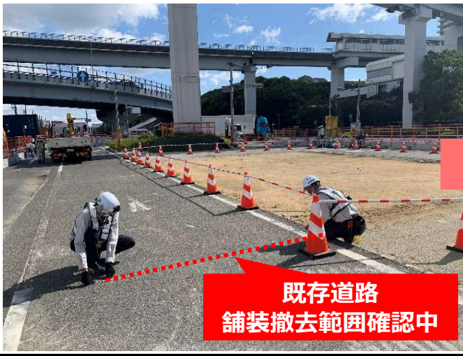
既存道路 舗装撤去範囲確認中

① 工事施工ヤード確保のため、既存道路の舗装撤去範囲の確認作業を行っています。(PPE-7~PE-1付近)