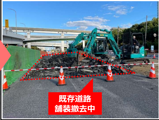
既存道路 舗装撤去中

② 工事施工ヤード確保のため、既存道路の舗装撤去作業を行っています。(PPE-7~PE-1付近)