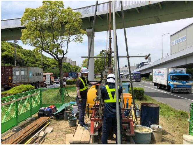
①地中ガスの有無等の調査をするためにボーリング掘削を行っています。(PPE-7付近)