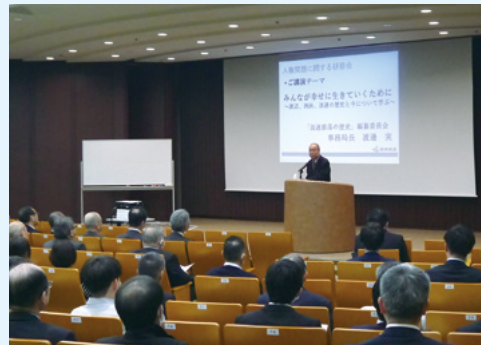
人権問題に関する講演会の様子

また、毎年12月の人権週間にあわせて、グループ全体での啓発に資するべく「人権標語」の募集を行うとともに、講演会を実施しています。