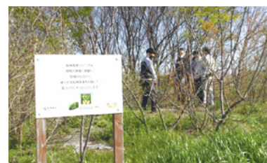
阪神高速グループの森