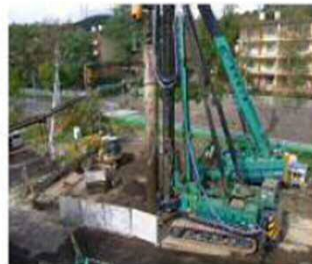
高速道路近傍での杭打設