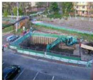
高速道路近傍での掘削